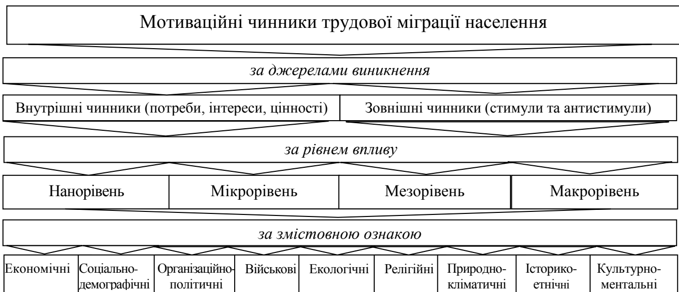
Рис. 1. Класифікація мотиваційних чинників трудової міграції населення

Розвиваючи положення мотиваційних теорій, запропоновано «мотивацію трудової міграції населення» визначати як процес взаємодії внутрішніх і зовнішніх рушійних сил, результуючим вектором якої є спонукання населення до трудового самовизначення шляхом переміщень. Ґрунтуючись на цьому, визначено, що поява міграційних настроїв та ступінь активізації міграційної поведінки працездатного населення є результатом прояву та взаємодії сукупності різноманітних мотиваційних чинників (економічних, соціально-демографічних, організаційно-політичних, військових, екологічних, релігійних, природно-кліматичних, історико-етнічних, культурно-ментальних, рис. 1), які на різних економічних рівнях багатоаспектно впливають на трудовий вибір населення, формуючи прагнення переміщатись в регіони (країни), де є більш привабливими стимули та можливості.