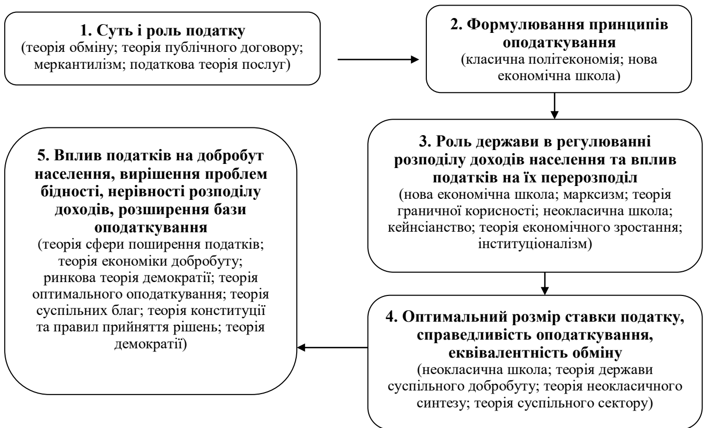
Рис. 1. Зміна акцентів наукових досліджень в концепціях державного регулювання доходів населення

Дослідження концепцій державного регулювання доходів населення виявили, що сучасна економічна наука, враховуючи тенденції економічного розвитку, змістила проблематику досліджень на вирішення питань впливу податків на добробут населення, проблем бідності, нерівності розподілу доходів та розширення бази оподаткування (рис. 1).