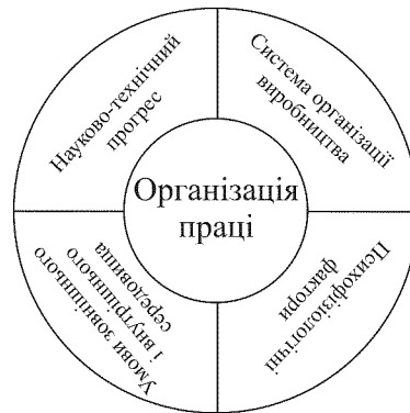
Рисунок 1 – Фактори, які впливають на організацію праці на машинобудівному підприємстві

Організація праці на машинобудівних підприємствах здійснюється в конкретних формах, різноманітність яких залежить від таких основних факторів, які зображені на рисунку 1.