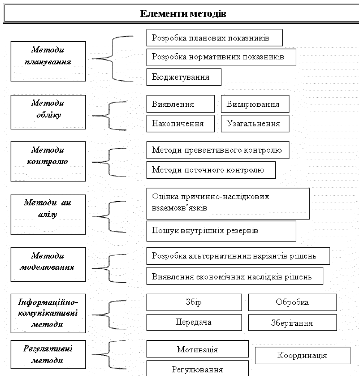
Рисунок 1 - Елементна інтеграція методів управлінського обліку

Іншими словами: становлення та розвиток управлінського обліку можливі на елементно-інтегрованому методологічному підґрунті, котре сформоване із сукупності