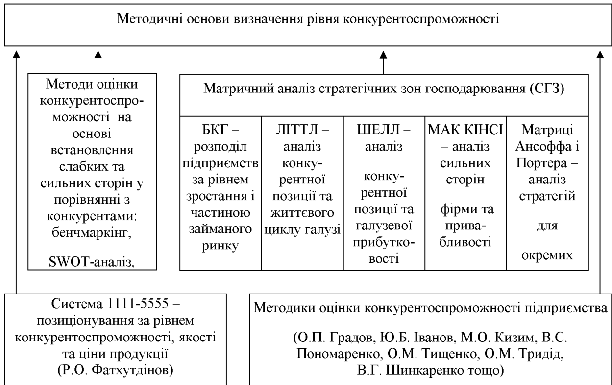
Рисунок 3 - Методичні основи, на підставі яких здійснюється оцінка конкурентоспроможності підприємства

Основну методології визначення рівня конкурентоспроможності вітчизняних підприємства складають методи, представлені на рис 3