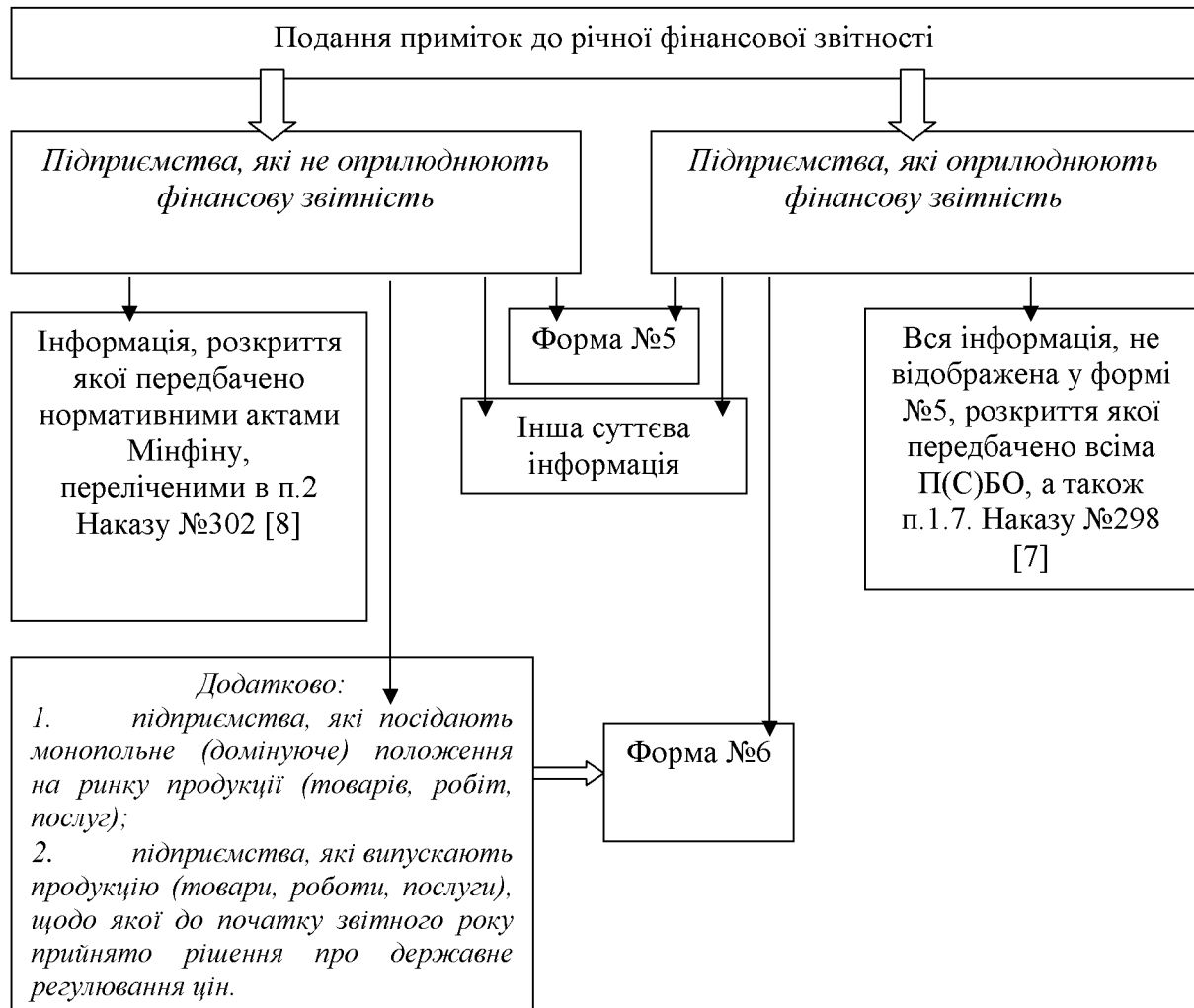
Рисунок 1 - Склад приміток до фінансової звітності

Проблемам врахування подій після дати балансу присвячено один з розділів П(С)БО 6 «Виправлення помилок і зміни у фінансових звітах». Відповідно до П(С)БО 6 події після дати балансу - це подія, яка відбувається між датою балансу і датою затвердження керівництвом фінансової звітності, підготовленої для оприлюднення, яка вплинула або може вплинути на фінансовий стан, результати діяльності та рух коштів підприємства (п.3).