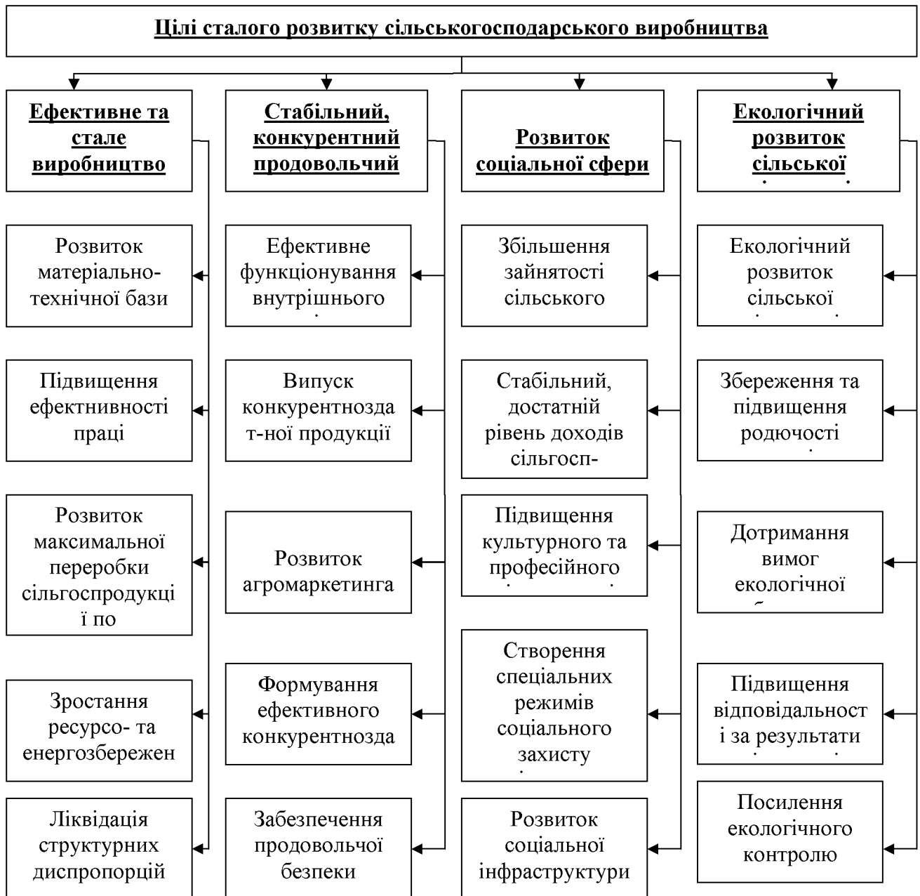
Рисунок 3 – Основні цілі стратегії розвитку сталого аграрного сектора економіки

Стратегічними напрямками розвитку сільського господарства регіону є: