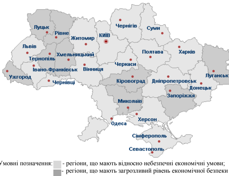
Рисунок 2 - Рівень економічної безпеки регіонів України на 2011 р.

показників економічного розвитку та економічної безпеки мають значну диференціацію за регіонами та незначну позитивну динаміку на кінець 2011 року. Розглянемо економічну ситуацію за регіонами, розділивши їх за показником ВРП у розрахунку на одну особу на дві групи: I – регіони, що мають відносно небезпечні економічні умови; II - регіони, що мають загрозливий рівень економічної безпеки (рис.2).