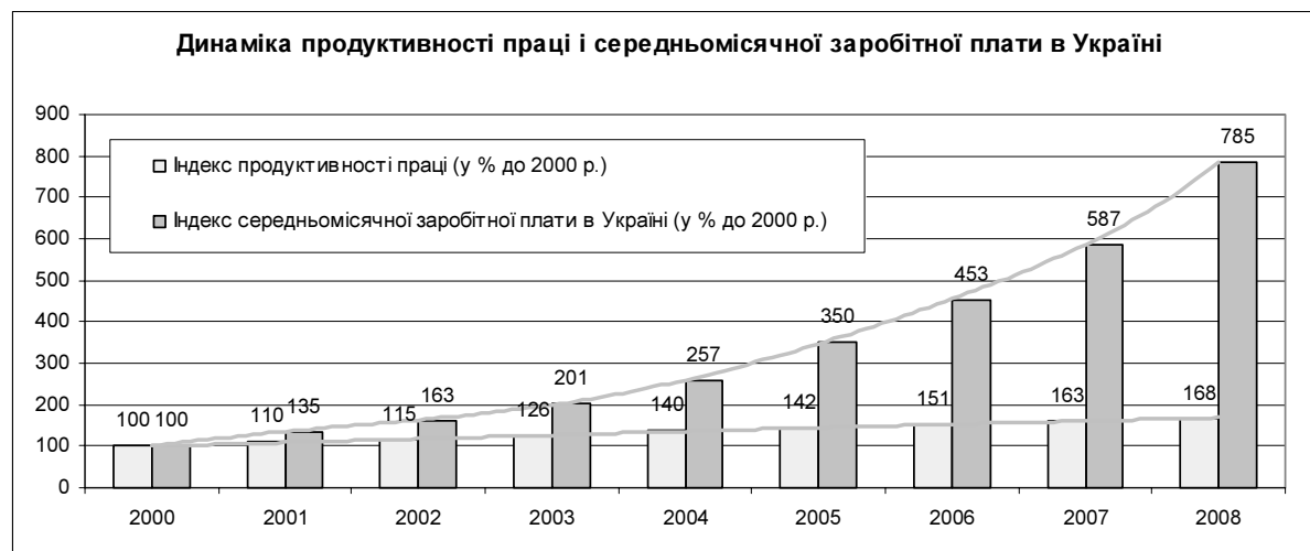
Рисунок 2 - Динаміка продуктивності праці і середньомісячної заробітної плати в Україні

Примітка: розраховано автором на основі джерел [5, с. 27, 549; 6].